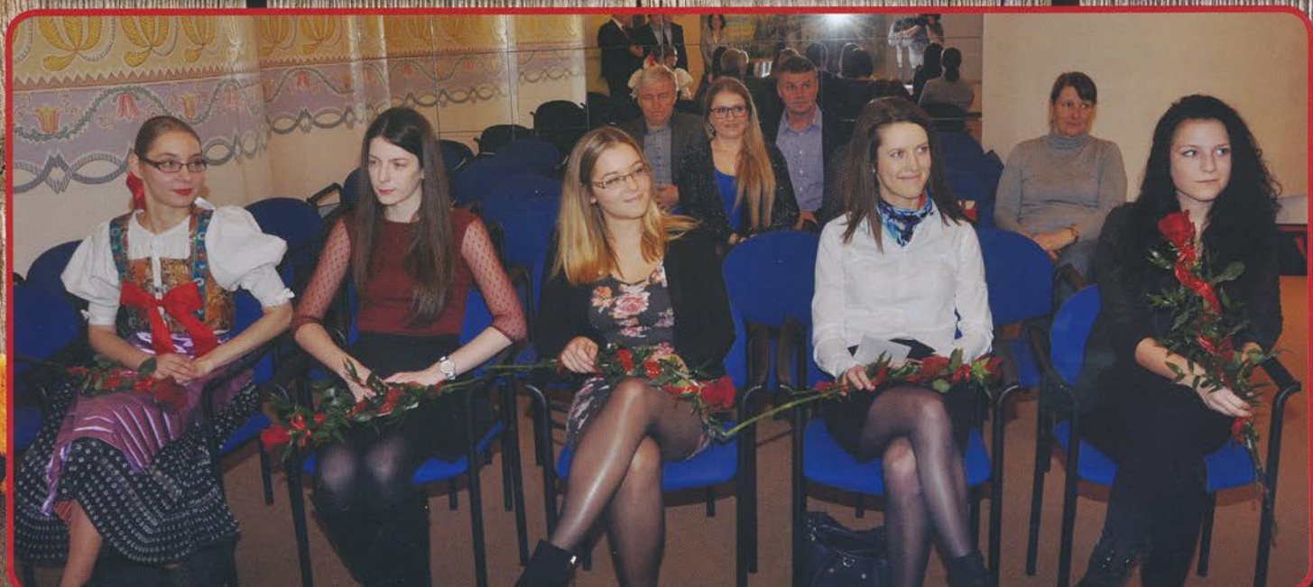
Obecné štipendium pre rok 2016 bolo udelené