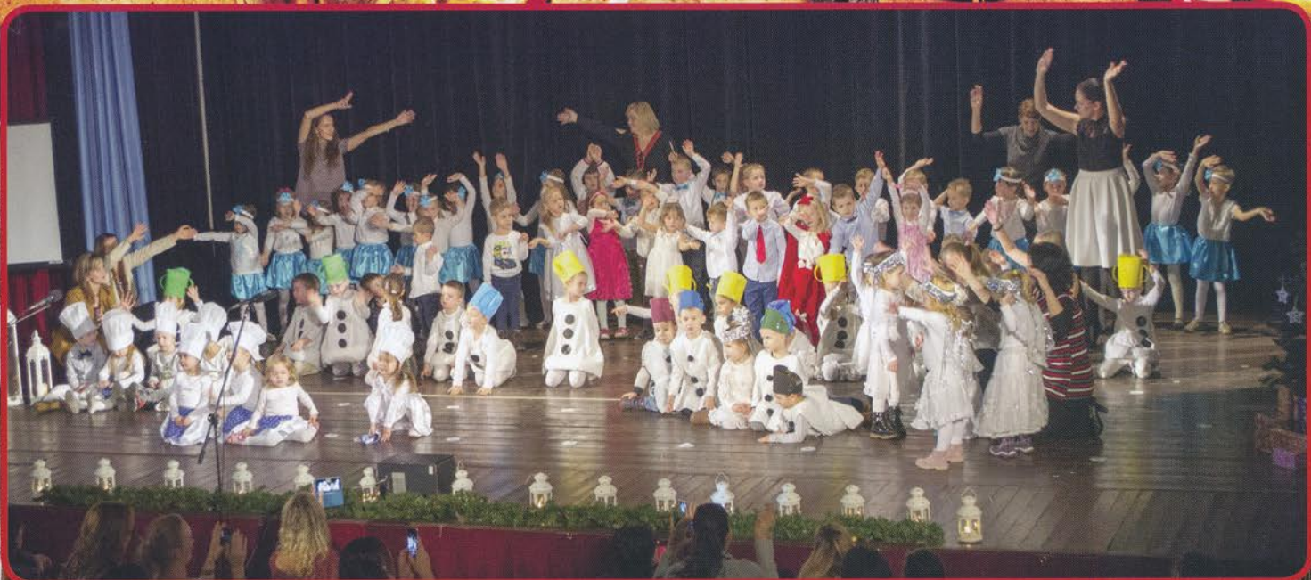
Vianočná akadémia materskej školy