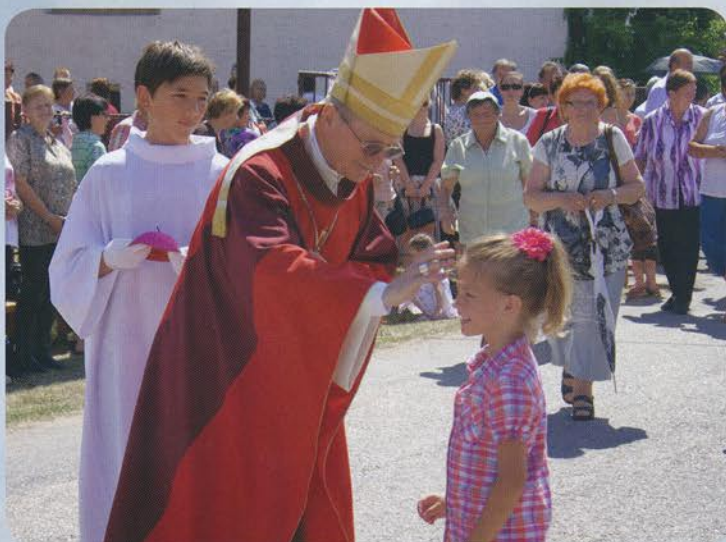
Otec biskup udeľuje požehnanie