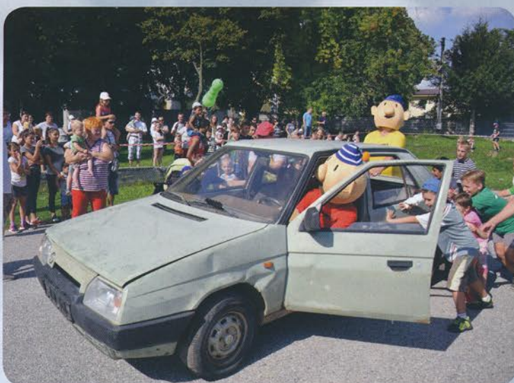
Rozlúčka s letom