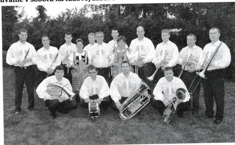
DH Močenská kapela

Viac o histórii močenskej dychovej hudby prezradí návštevníkom Dní obce výstava fotografií, ktorá sa bude nachádzať v Spoločenskej sále obecného úradu v Močenku.