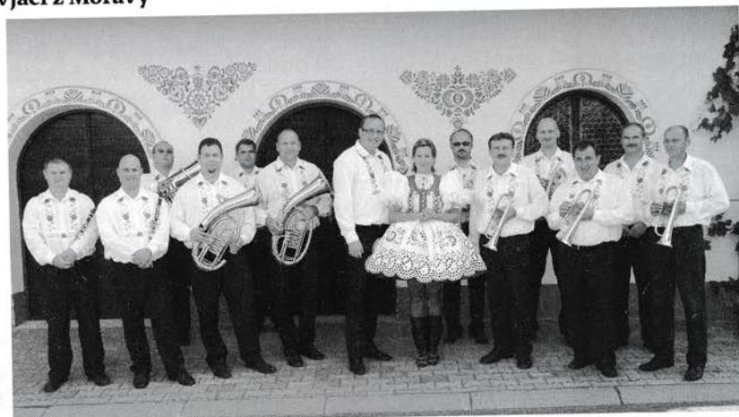
DH Vacenovjáci z Moravy

Vacenovjáci z Moravy je krojovaná dychová hudba, ktorá vydala dvadsať hudobných nosičov. Táto dychová hudba dvakrát zvíťazila v súťaži Zlatá krídlówka. Okrem toho je dvojnásobným držiteľom ocenenia Najúspešnejšia dychová hudba Dychovej hitparády ČRo Praha.