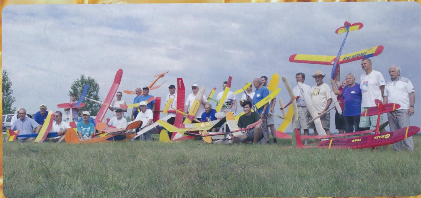
Leteckí modelári sa stretli na Sýkach