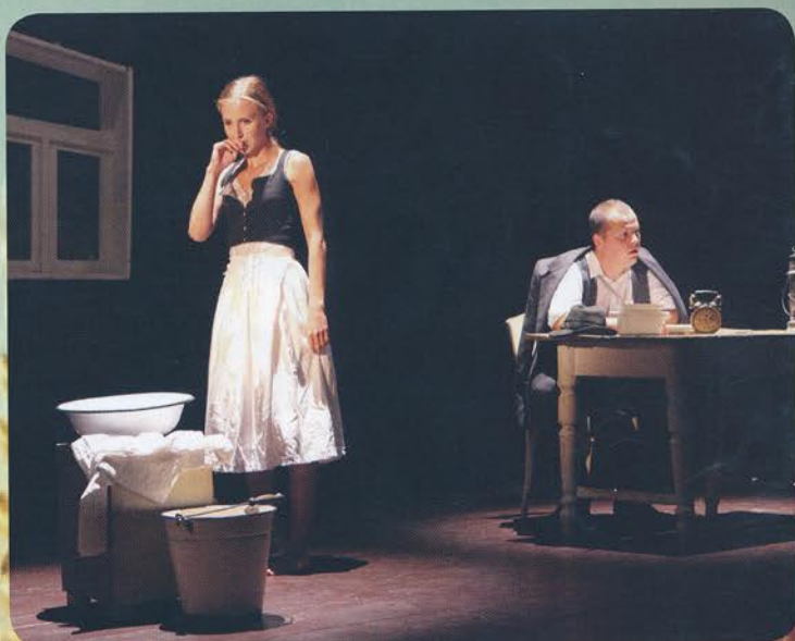
Gorazdov Močenok 2016