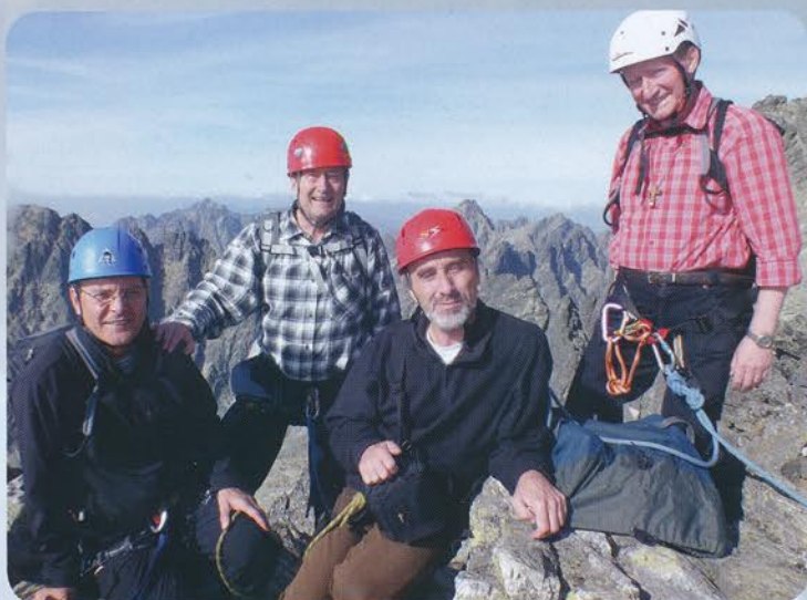
Otec biskup v horách