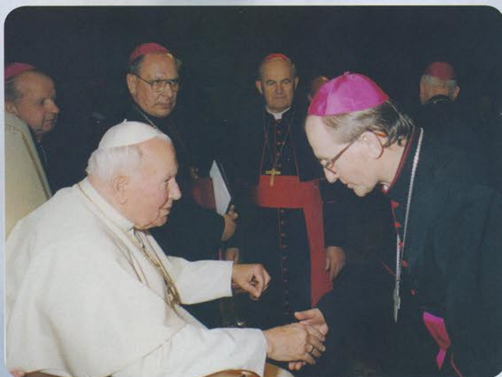
Osobné stretnutie s Jánom Pavlom II.