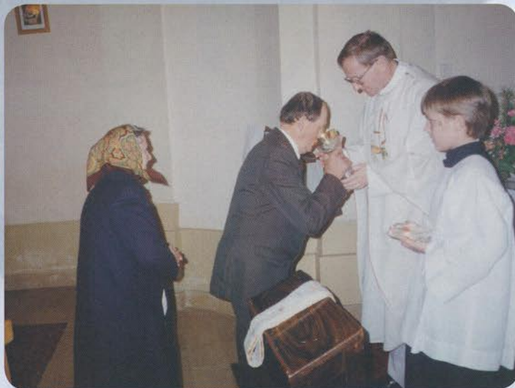
Otec biskup dáva sväté prijímanie svojim rodičom pri príležitosti 60. výročia ich sobáša