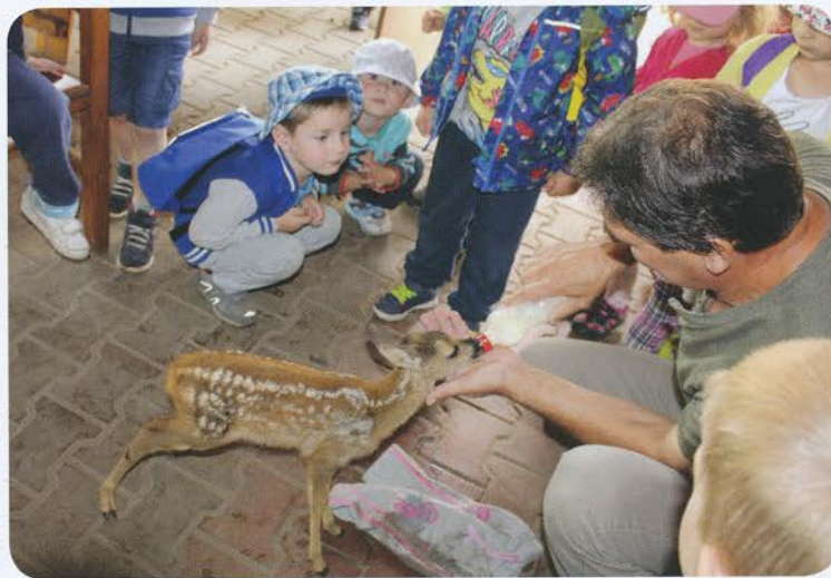
Deti z MŠ na farme Ičkeska