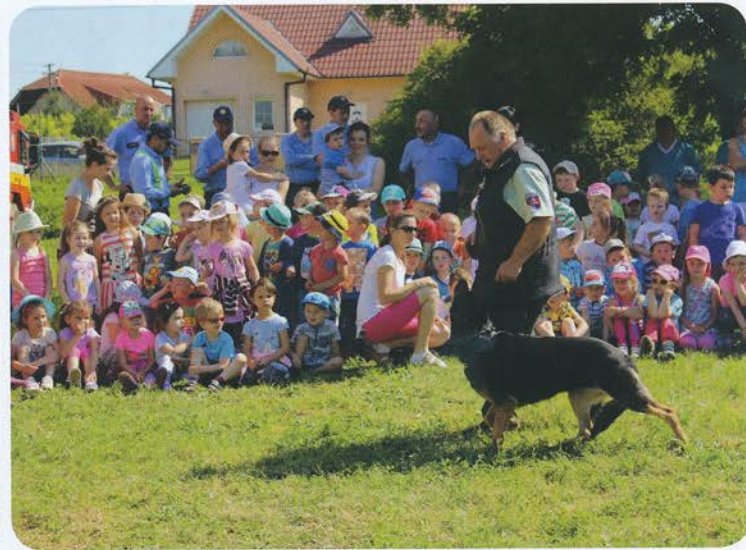
Policajti a hasiči v MŠ