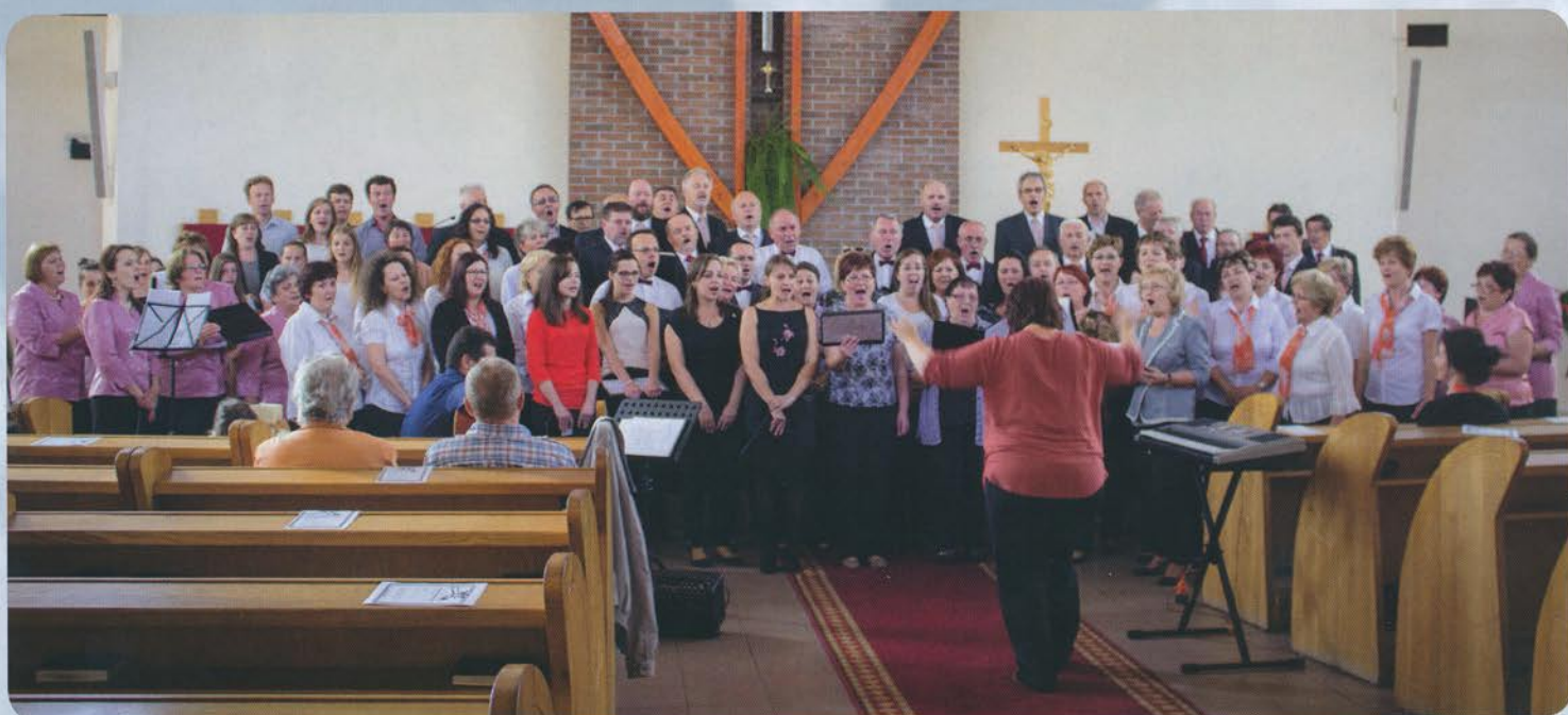
Zbor na festivale v Rajeckých Tepliciach