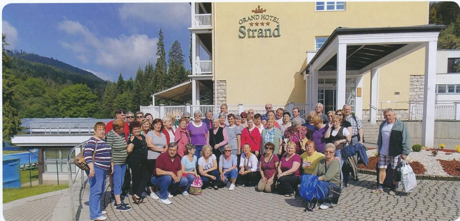
História, kúpele a príroda s OZ RUBÍN