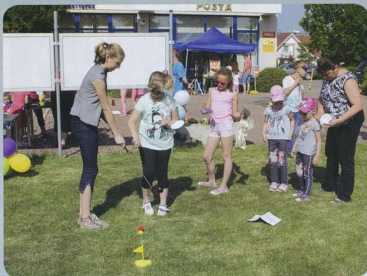
Deň detí oslávilo spoločne viac než 100 detí