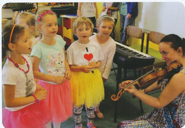
Vystúpenie ZUŠ v škôlke