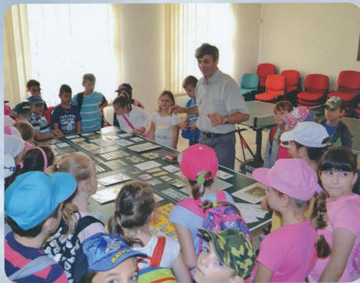
V centre voľného času budú nové krúžky