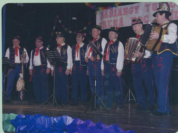
Fašiangové vystúpenie Močenských spevákov