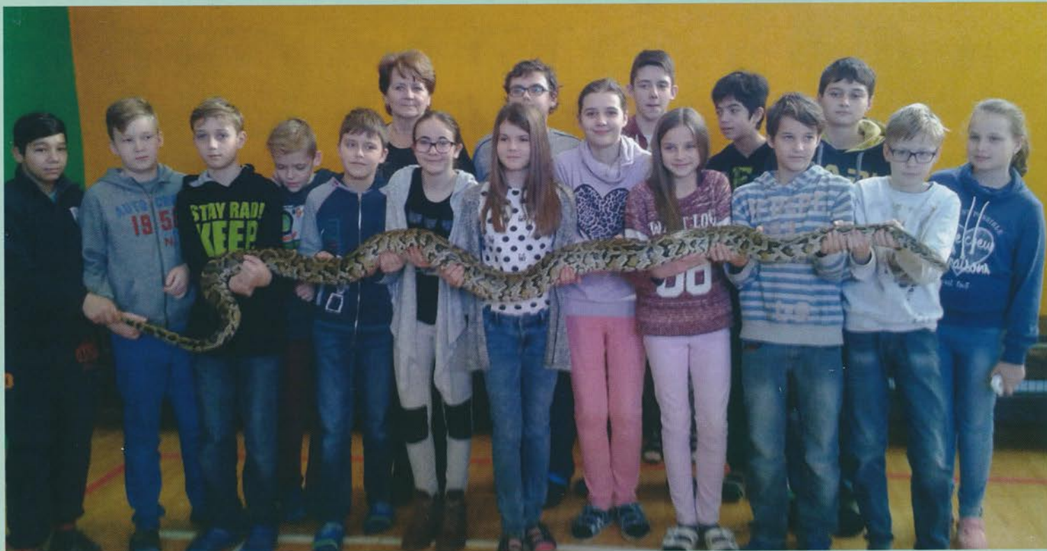
Výstava plazov v Základnej škole Močenok