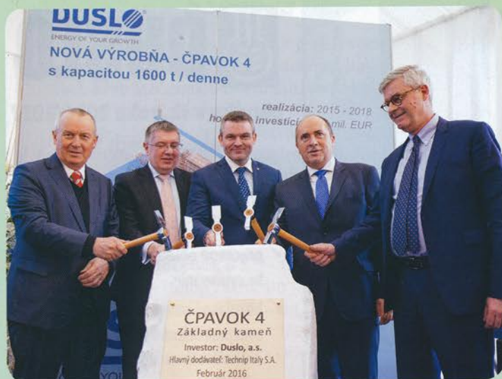
Poklepanie základného kameňa Čpavku 4