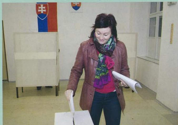
Voľby do Národnej rady Slovenskej republiky 2016