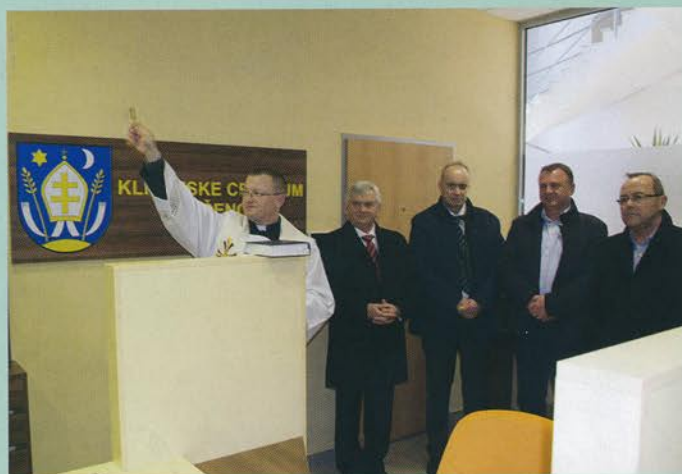
Otvorenie klientskeho centra