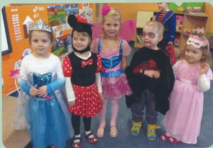
Karneval v Materskej škole Močenok