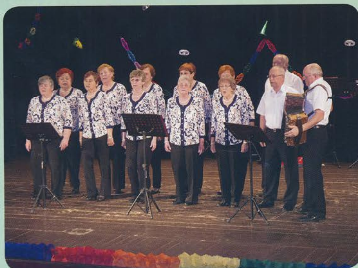
Vystúpenie Zúgovanky v rámci Fašiangového popoludnia