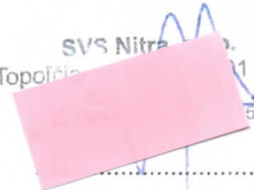
Zdenek Studený konateľ